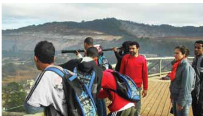
Figura 8. Professores de História, Ciências e Geografia (à direita) e alunos observando a paisagem.

da observação. Quando os alunos quantificaram suas observações em níveis de alteração, eles assim fizeram dentro das orientações – dadas previamente – que se referiam à degradação ambiental, às mudanças ecológicas e paisagísticas da cidade. Competia aos alunos notificar, partindo dos elementos de paisagem dispostos no formulário, quais desses elementos tinham sofrido alteração e qual era o grau dessa alteração.