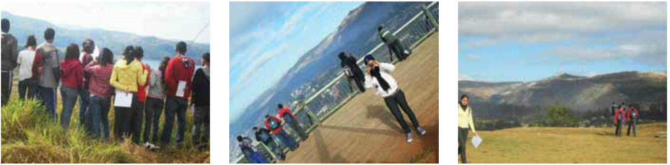
Figura 5. Fotografia de Campo.

análise dos dados obtidos a partir do formulário. No entanto, essa escala só possui sentido se forem atribuídos a ela dados provenientes das matrizes do “Formulário Ambiental” exposto neste trabalho, e se ela for entendida e interpretada da forma exposta aqui. Observando isso, perceber-se-á que ela é muito útil para apontar quantitativamente interpretações e observações subjetivas e qualitativas. O nome da escala vem de uma homenagem dos participantes do projeto ao poeta Carlos Drummond de Andrade, que viveu e sofreu com as alterações da paisagem de uma cidade que durante o século XX conheceu o poder devastador de mineradoras 5 . Vale ressaltar que a maior alteração paisagística percebida pelo ilustríssimo poeta e pelos habitantes mais antigos foi a total dissolução do Pico do Cauê, hoje chamada cava da mina do Cauê – que é uma grande abertura de vários metros de largura e profundidade, facilmente visto do mirante visitado “Morro da Pousada”.