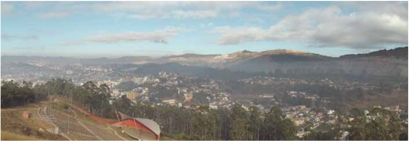
Figura 2. Fotografia da paisagem do Pico do Amor. Nota-se as construções urbanas, o reflorestamento com eucalipto de parte do Pico e extração de minério de ferro ao fundo.