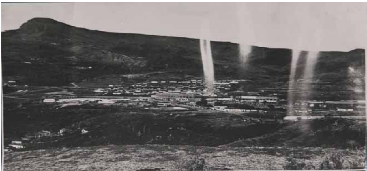
Figura 4. Fotografia antiga do Pico do Cauê no ano de 1932, antes da extração mineral.

níveis pré-estabelecidos. O projeto reconhece as limitações que essa transposição qualitativo-quantitativa propõe, contudo os professores ressaltam os ganhos práticos e estatísticos que tal tarefa traz à pesquisa.