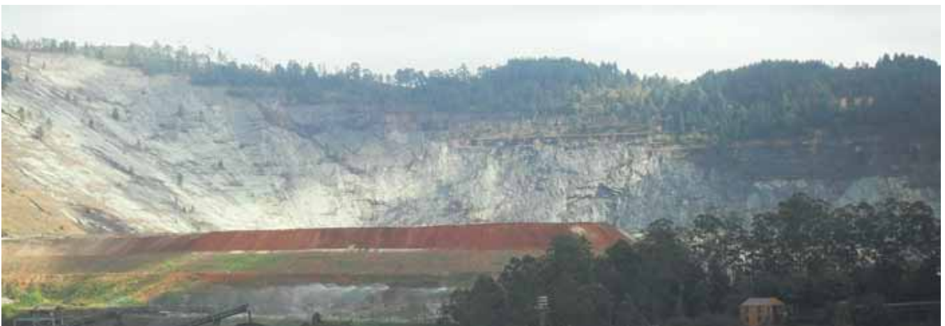
Figura 3. Fotografia da paisagem do Morro da Pousada. Nota-se a cava do antigo Pico do Cauê e a indústria de mineração em funcionamento.

aleatória para a paisagem observada em cada mirante. As palavras foram: