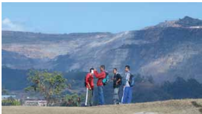
Figura 6. Alunos registrando as paisagens.