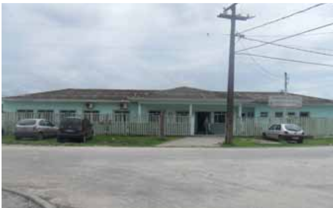
Creche com capacidade para atender 150 crianças da comunidade.