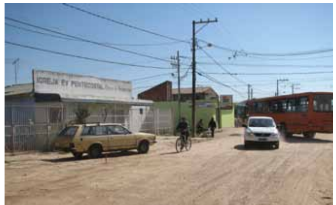
Ligações regulares de energia elétrica, instaladas pelo Poder Público.