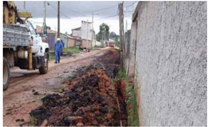
Instalação regular do sistema de água e esgoto.