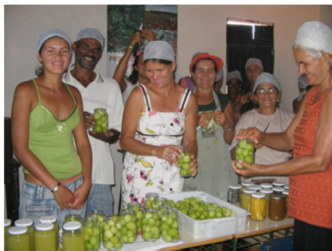
Figura 3. Armazenamento e Aproveitamento das Frutas Excedentes

Paralelamente ao aumento da produção de frutas, verduras e leguminosas, os agricultores foram incentivados e orientados a articular-se em associações, para promover a venda de produtos excedentes. Com o apoio do IPB na elaboração de projetos, as associações criadas conseguiram adquirir galpões para uso compartilhado, assim como máquinas despoldadeiras, visando comercializar parte dos seus produtos já “industrializados”, na forma de polpas de suco e geleias, buscando aumentar a renda familiar e evitar desperdícios, conforme demonstra a Figura 3.