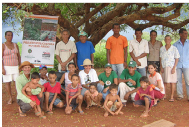
Figura 4. Agricultores e Seus Familiares Integrantes do Projeto

Verificou-se que o capital social (confiança estabelecida entre os atores) foi estimulado, tanto que o plantio e o manejo dos campos de Policultura foram realizados, na maioria das vezes, em mutirões. Também a comercialização dos produtos excedentes foi realizada de forma coletiva, através de uma das associações criadas a partir do projeto.