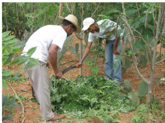
Figura 6. Agricultores realizando a cobertura do solo

A técnica de realizar a cobertura do solo (demonstrada na Figura 6) foi comprovada pelos participantes do Projeto como altamente eficaz para reduzir a quantidade de água necessária para irrigação e aumentar a produtividade. Os agricultores utilizam resto de culturas (como palha de milho, mamona e feijão, assim como resíduo do sisal) para colocar sobre o solo e ao redor do caule das plantas. O objetivo dessa técnica é formar cobertura vegetal densa, rica em nutrientes e material orgânico, que cumpre duplo objetivo: nutrir o solo, dispensando a utilização de fertilizantes industriais, e baixar a temperatura do solo, reduzindo a evaporação.