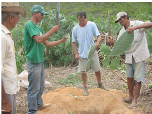
Figura 5. Agricultores picando palma, planta típica da Caatinga, composta por cerca de 90% de água, para o preparo do solo

Uma das técnicas aplicada foi a utilização da palma e do mandacaru, plantas típicas da Caatinga, picadas em pedaços pequenos e sendo colocadas em buracos ao lado de outra cultura (conforme Figura 5). Desta forma, a palma e o mandacaru, que armazenam naturalmente muita água, cedem parte de sua reserva para outras plantas.